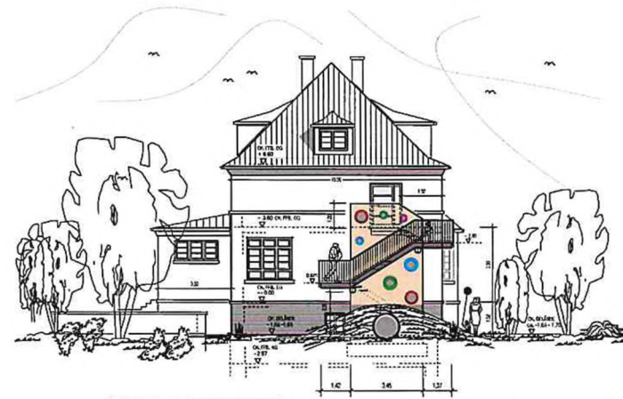
NORD - WEST ANSICHT

RETTUNGSWEG - AUSSENREPPY. AUS OBERGESHOSS - FÜR KINDERTAGESSTÄTTE (3. GRUPPENRAUM)