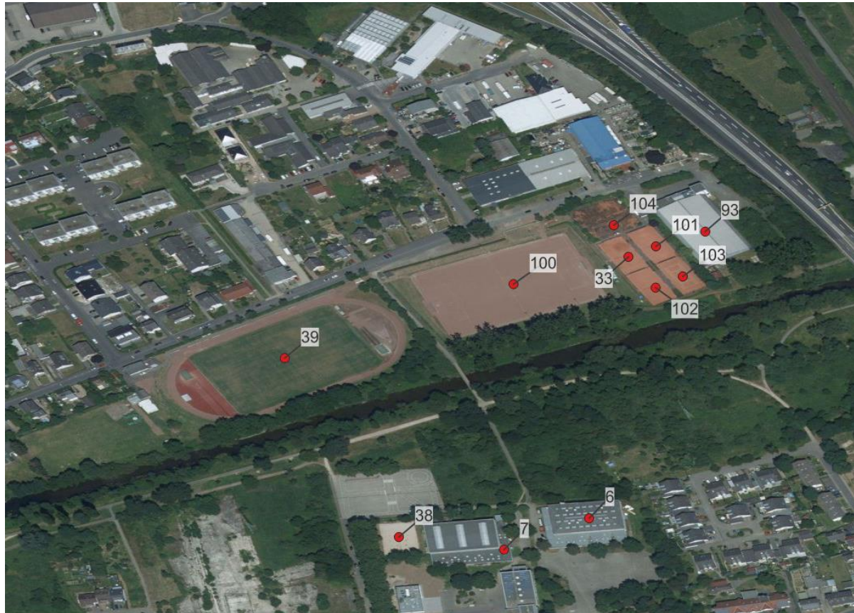
Sportstätten in Sinzig vor der Flut