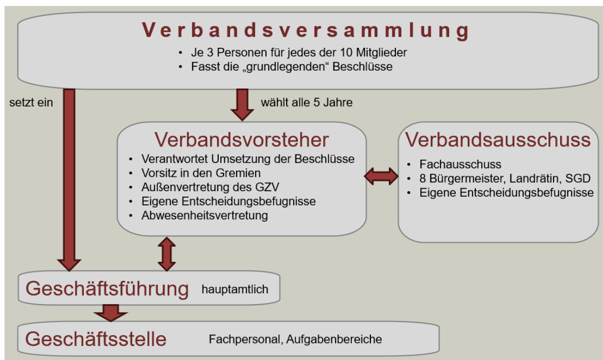
Übersicht der geplanten Verbandstruktur

Die Person für die Funktion Verbandsvorsteher wird von der Verbandsversammlung für 5 Jahre gewählt, ebenso ein oder mehrere Personen als Stellvertreter. Sie ist verantwortlich für die Durchführung der laufenden Verbandsgeschäfte unter Beachtung dieser Verbandsordnung, der Geschäftsordnung sowie des jährlichen Wirtschaftsplans. Sie ist an die Beschlüsse der Verbandsversammlung gebunden und auf sie sind die in § 10 Abs. 1 VO aufgelisteten Entscheidungsbefugnisse übertragen. Sie führt den Vorsitz in den Gremien und vertritt den Verband gerichtlich und außergerichtlich.